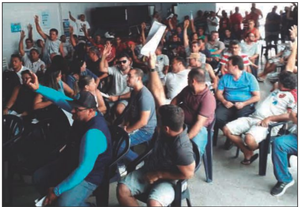
▲ Companheiros e companheiras presentes à assembleia deliberam, por maioria, pela rejeição

Chegou-se ao cúmulo de ser sugerida por um dos presentes "penalidades para dirigentes do sindicato". Quem tem essa visão de crucificar sindicalista é a burguesia,