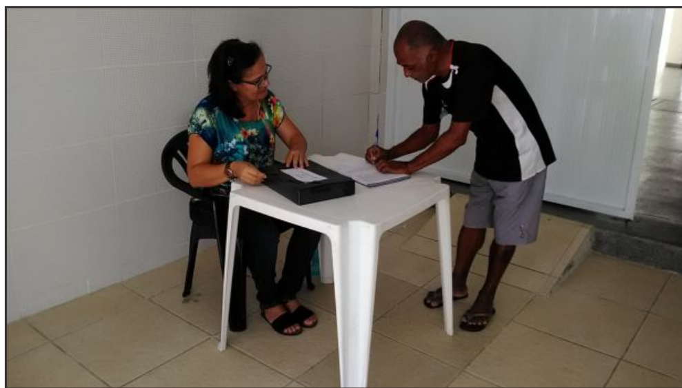
▲ VOTAÇÃO | Eleição transcorreu de forma tranquila em todas as urnas, nos dois dias

O SINDISAN agradece a participação dos 1.175 companheiros e companheiras votantes nesta eleição, que fortaleceram, assim, os fóruns deliberativos do sindicato.