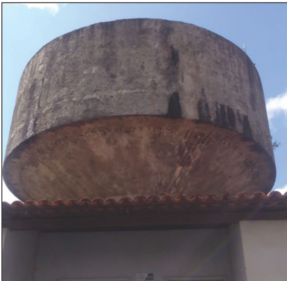
▲ Deterioração do cimento é visível, já aparecendo toda a estrutura de metal na caixa

Estão postergando isso, não se sabe por qual razão, e levando risco desnecessários aos trabalhadores e à população. Existem unidades que apresentam condições de risco sério, como, por exemplo, o reservatório suspenso de Santana do São Francisco (confira na foto), que apresenta grande quantidade de desagregação do concreto, com a ferragem já estando toda exposta. Urge a recuperação dessas unidades onde os problemas são mais críticos!