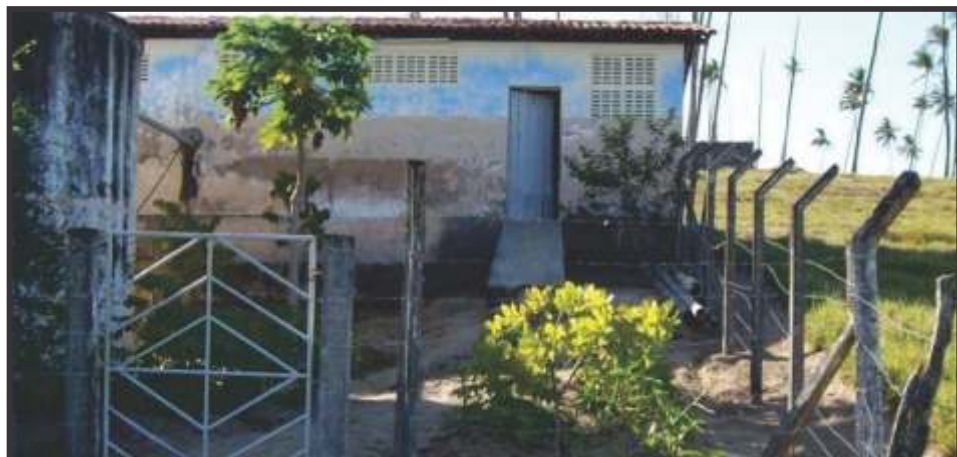
► Abandono: Na ETA de Indiaroba, cercas caindo não dão segurança a ninguém

O SINDISAN convida toda a categoria para a solenidade de posse da sua Diretoria eleita (triênio 2011/2014), que acontecerá na sede do sindicato, dia 26/8, Sexta-feira, às 19 horas.