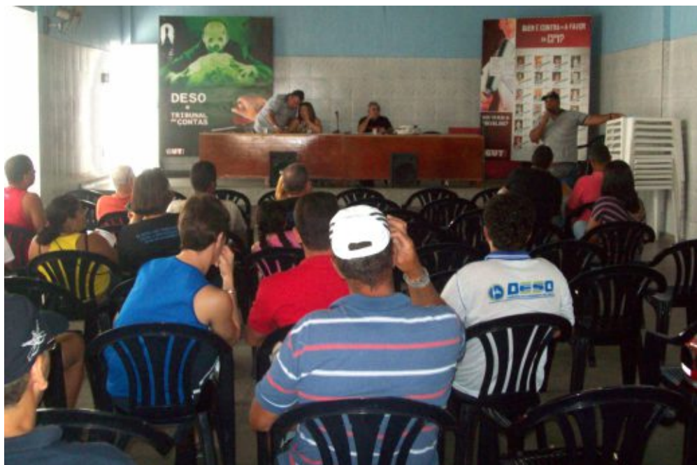
| Companheiros e companheiras participaram ativamente da construção da pauta de reivindicações

E mais, Auxílio Educação com aumento da idade para 15 anos e o reajuste de acordo com o reajuste das escolas; e mais supressão do item no atual Acordo Coletivo que exclui os aposentados que continuam trabalhando na Deso do benefício de complementação sobre auxílio-doença e auxílio-acidente pagos pelo INSS, após 15 dias; entre outras reivindicações.