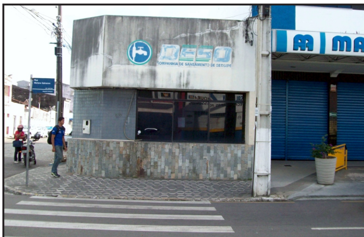
Posto de Atendimento do Siqueira Campos está fechado