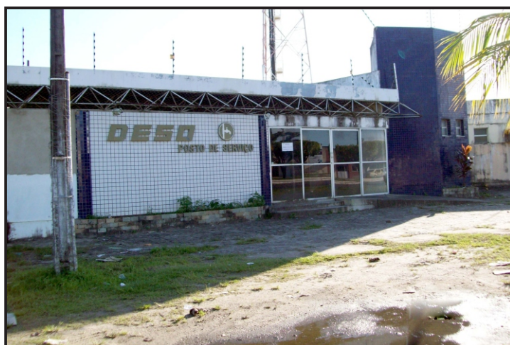
Posto de Atendimento da DESO completamente abandonado

O SINDISAN lastima essa lógica de autodestruição, que não vem de agora, adotada por alguns administradores da companhia, que talvez, seguindo ordens expressas de alguns que têm interesses futuros e pouco honestos no total afundamento da DESO para que, com isso, possa justificar a sua total dissolução como uma autarquia pública de grande relevância.