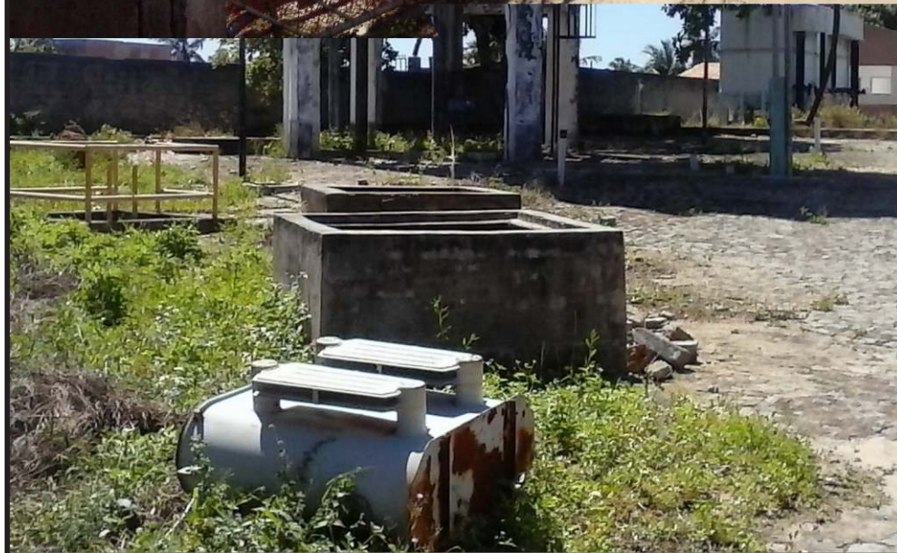
Mais um patrimônio da DESO completamente abandonada e mal aproveitado