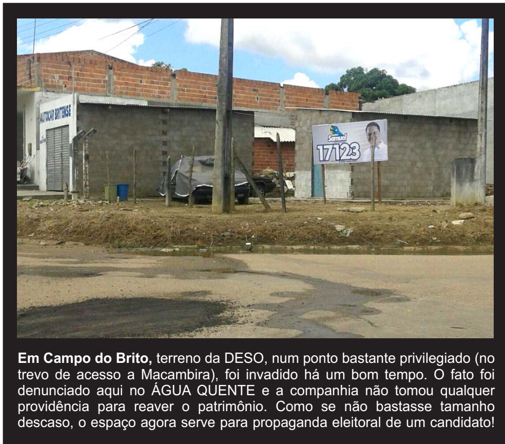
Em Campo do Brito , terreno da DESO, num ponto bastante privilegiado (no trevo de acesso a Macambira), foi invadido há um bom tempo. O fato foi denunciado aqui no ÁGUA QUENTE e a companhia não tomou qualquer providência para reaver o patrimônio. Como se não bastasse tamanho descaso, o espaço agora serve para propaganda eleitoral de um candidato!