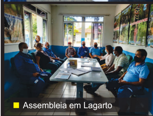
■ Assembleia em Lagarto