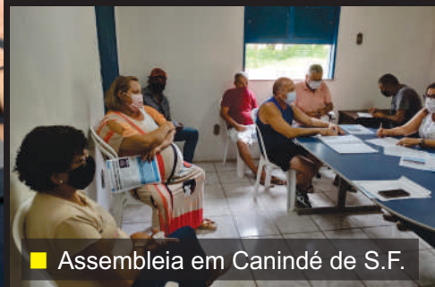
■ Assembleia em Canindé de S.F.