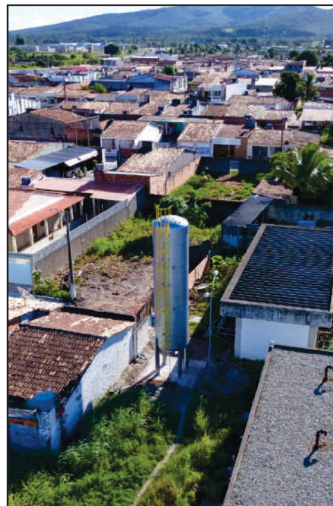
▲ O filtro (ao centro) foi instalado de forma incompleta e área ficou totalmente exposta

Espera-se mais da DESO neste sentido, até para evitar essas manifestações de descontentamento, por parte da população, contra a Companhia, por obras supostamente mal-executadas. Obviamente, o desgaste recai sobre a Companhia, não sobre a empresa terceirizada.