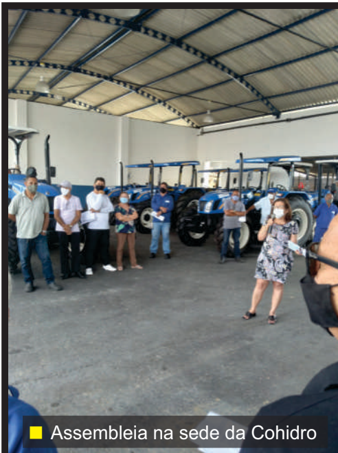
■ Assembleia na sede da Cohidro

O SINDISAN vem alertar a diretoria da DESO sobre essa questão e cobrar apoio a esses e a outros companheiros que passam pela mesma situação. É preciso garantir a integridade física desses trabalhadores e cobrar dos órgãos de Segurança Pública ações efetivas para investigar e punir quem ameaça a vida daqueles que estão prestando serviços à população e tentando minimizar o problema da falta de água, sem ter nenhuma culpa sobre isso. É preciso atuar imediatamente, antes que uma tragédia aconteça.