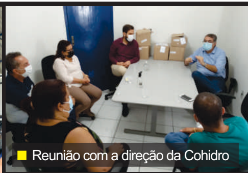
■ Reunião com a direção da Cohidro