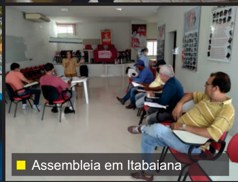
■ Assembleia em Itabaiana