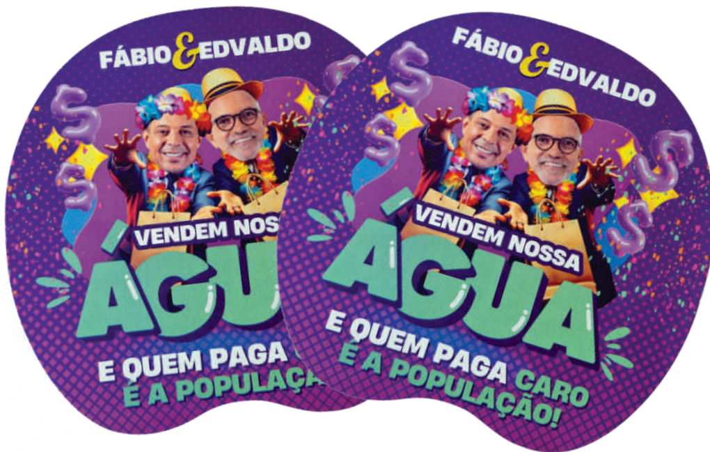
▲ Siri na Lata vai estar nas ruas denunciando os privatistas da água

“Tragam seus cartazes, sua fantasia e vamos fazer o protesto com irre-