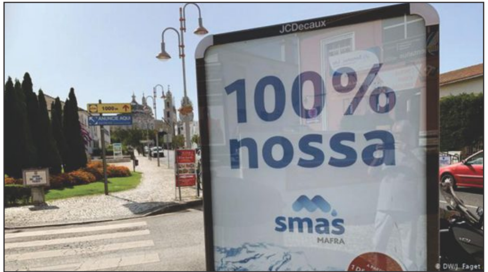
▲ Cidade de Mafra, na Região Metropolitana de Lisboa, retomou o controle de suas águas

Leia mais no site da Deutsche Welle em português: bit.ly/2ME4wCu