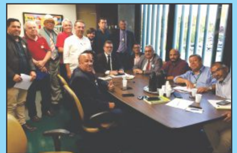
▲ Dirigentes urbanitários reunidos em Brasília